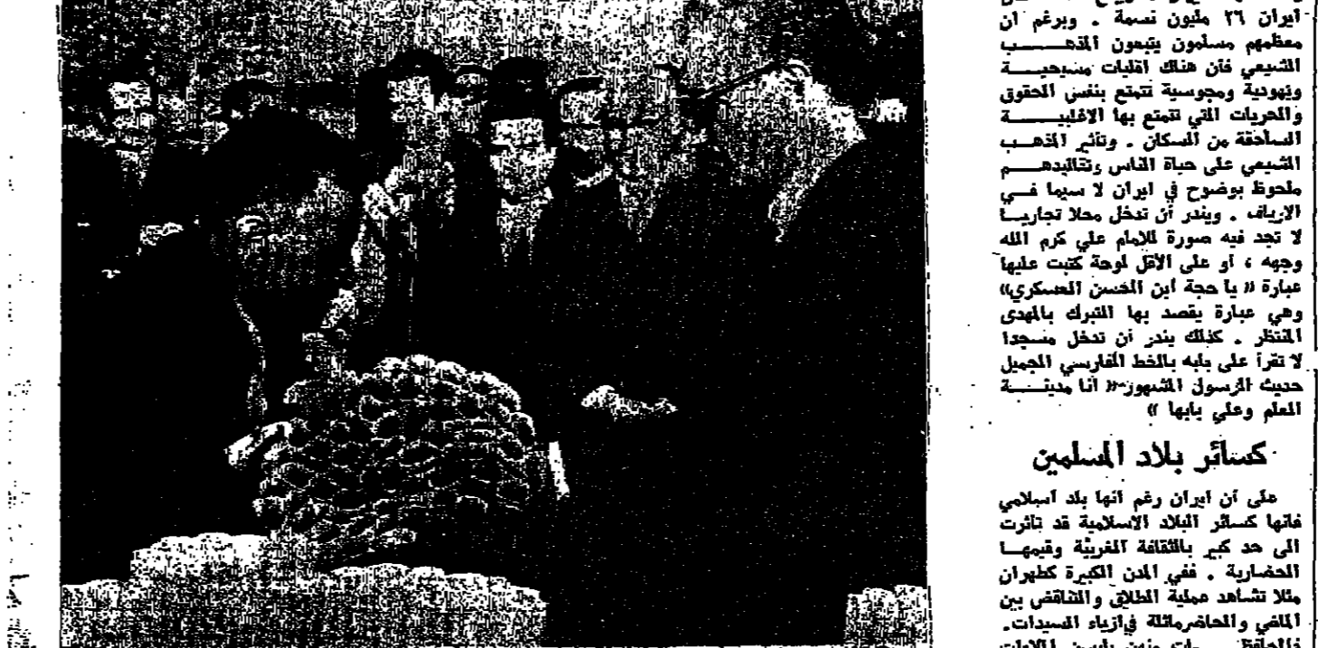
شاه ايران يوزع سندات التملك على الفلاحين بموجب قانون الإصلاح الزراعي .

الذي تبنى بإيجاد إيران القديمة وفروقاتها كما لم يفعل شاعر من قبل . إيران الحديثة مدينة بالازدهار والتقدم اللذين حققتهما « الشاه » والتي برزناج الإصلاح الذي اعقبه الشاه سنة ١٩٢٦ . فلقد سعى الشاهان الرئيس الذي يد حركة التطوير في إيران بالمال الثمير والاولاه